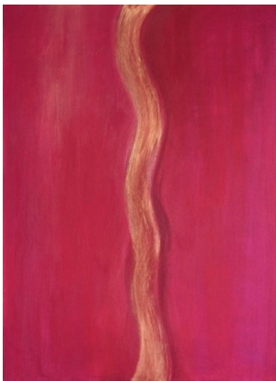
Sarit Lichtenstein, „México“, 2013, Acryl und Goldpigmente auf Leinwand, 90 x 70 cm.

Vernissage: Dienstag, 8. Mai 2018 in der Galería de la Televisión Educativa de México Avenida Circunvalación s/n Esquina Tabiqueros, Col. Morelos 15270 México, CDMX