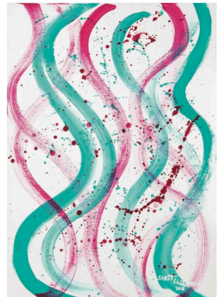
Sarit Lichtenstein, „Amor Puro“, 2018 Acryl auf Leinwand, 90 x 70 cm.

Für die Ausstellung wählte die Galerie AM PARK den Titel „Sarit Lichtenstein – Amor Puro“ und bezieht sich damit auf das gleichnamige Gemälde aus dem Jahre 2018. Die Ausstellung ist als Wanderausstellung geplant und soll in verschiedene Institutionen und Museen in Mexiko gezeigt werden, unter anderem in der Casa de Coahuila in Mexico City.