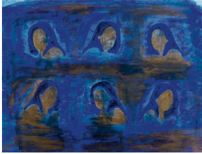
Sarit Lichtenstein, „Autorretrato“, 2006, blaue und goldene Pigmente auf Papier, 50 x 66 cm

1961 in Mexico City geboren, studierte sie dort von 1980 bis 1984 am Instituto Nacional de Bellas Artes in Mexiko. Danach setzte sie von 1984 bis 1986 ihre Studien am Istituto Europeo di Design in Rom fort um anschließend von 1988 bis 1990 an der israelischen Bezalel Art Academy in Jerusalem zu studieren.